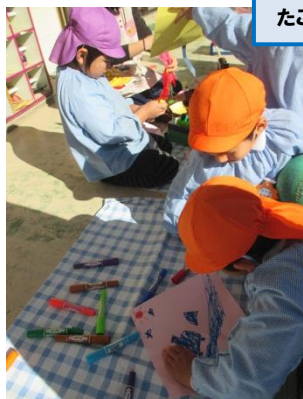
3~5歳児 たこを作ってみました