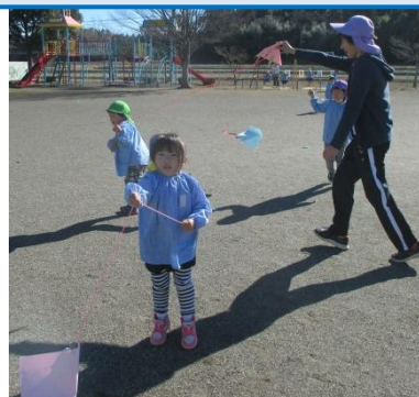
飛ばない!走ったら飛ぶかな?