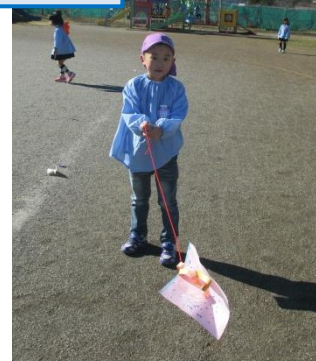
あれ?走らなくても飛んだ!