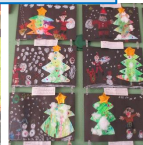
5歳児 クリスマスツリーの制作