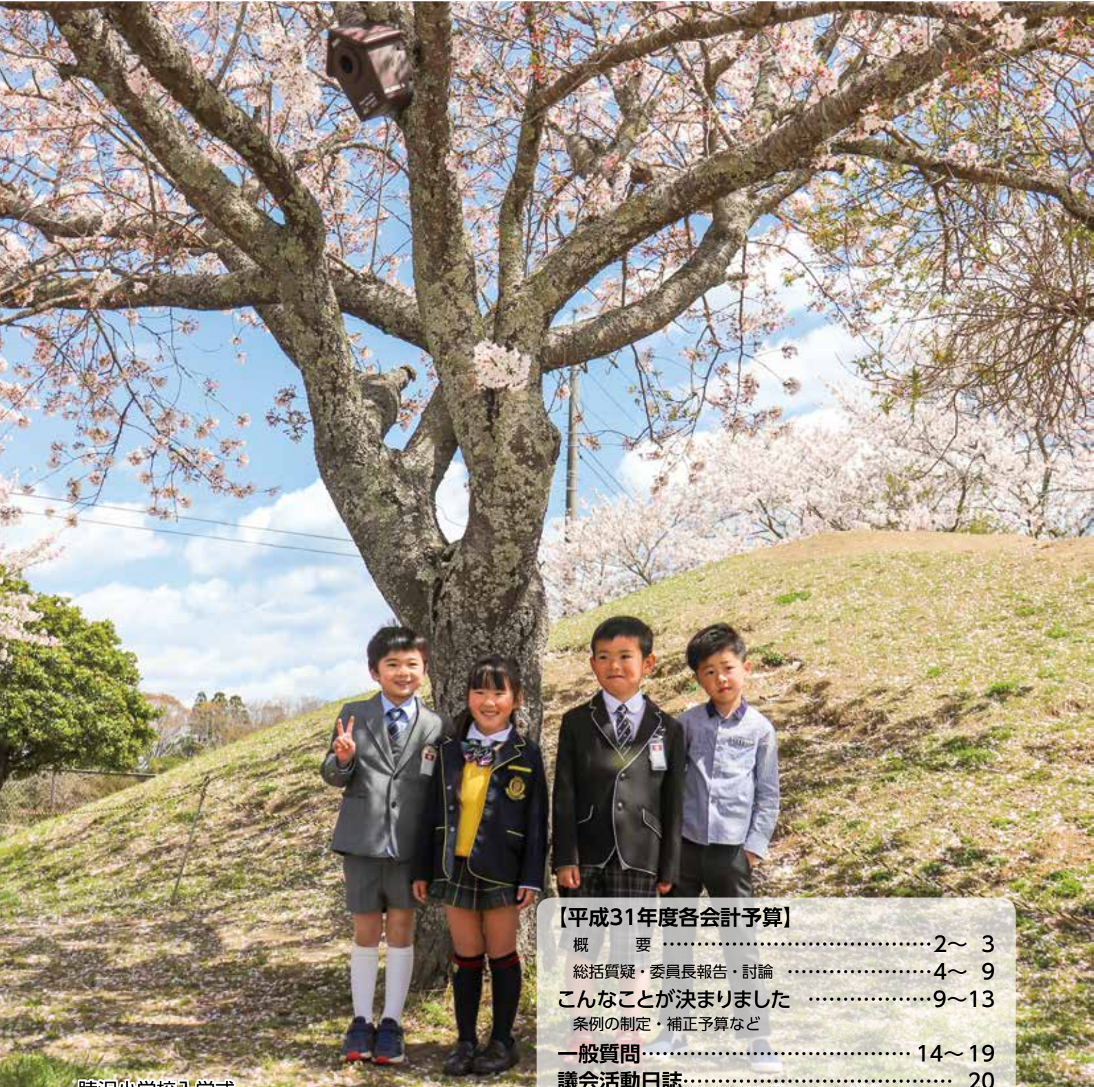
睦沢小学校入学式