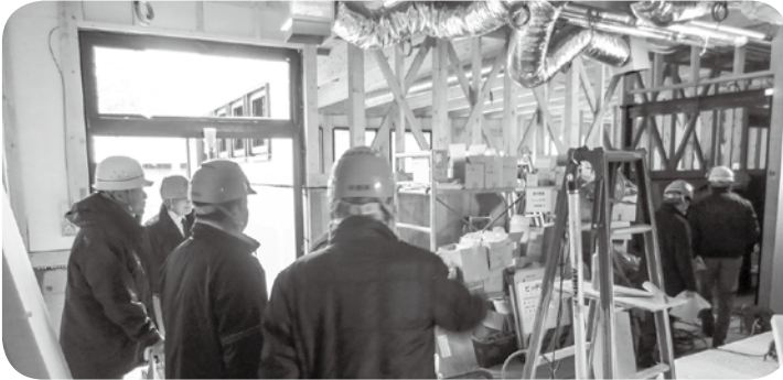
建設が進む道の駅（内部）

財政の根幹を成す町税は、7億円余りの予算計上で減額傾向にある。当然ながら国県の依存財源に頼らざるを得ない。新年度は「むつざわスマートウエルネスタウン拠点形成事業」にかかると11億円余りの多額の歳出が予定されている。国の補助金、町の借入金等により対応するとしてもその差額が生じ厳しい財政運営が予測される。新年度予算の執行にあたり、町長の所信を伺いたい。