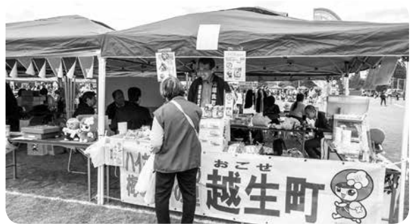
交流をしている越生町のブース（農林商工まつり）