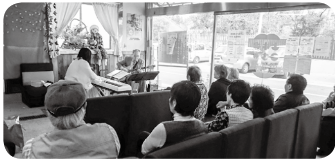
上市場こぢや倶楽部

町長 30年度末で1億347万円、補正後1億6千351万円です。今後もできるだけ積み立ててまいります。