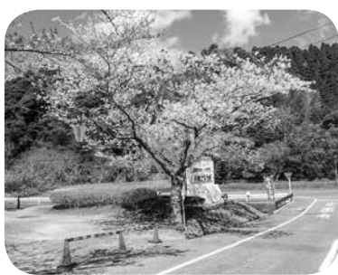
房総カントリーの桜

健康保険課長 8.5割軽減につきましては今年の10月から1年間はそのままです。9割軽減の方は10月以降本則の7割に戻しますので年度では8割になります。消費税の引き上げ以降低所得者につきましては基本的に月5千円程度支給されます。支給されない8.5割の方は1年間そのままです。 議員 9割軽減の方の負担は増えるのかそれとも減るのか。 課長 9割軽減の方は後期高齢者医療の中で負担増ですが年金で補填されることで7割軽減になります。