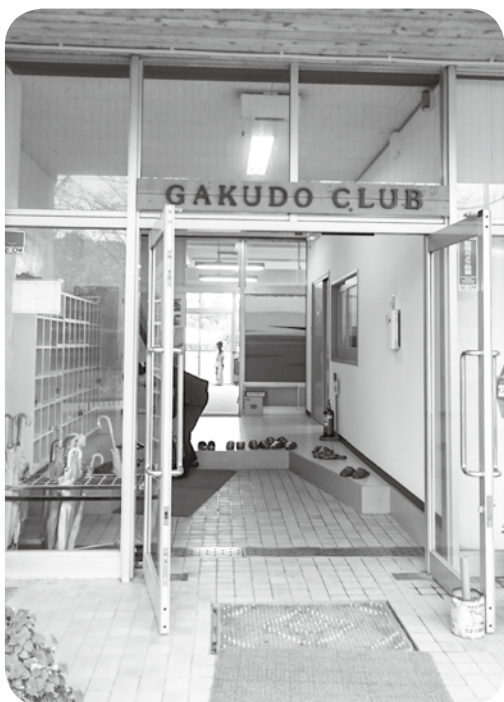
児童クラブの入口