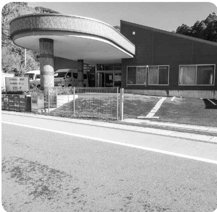
特別養護老人ホーム

福祉課長 第7期計画の初 年度なので高めの予算設定 になっていました。今年度 以降3年間の間に給付・対 象者が増える見込みです。 居宅サービスが減り施設 が伸びている状況にありま す。