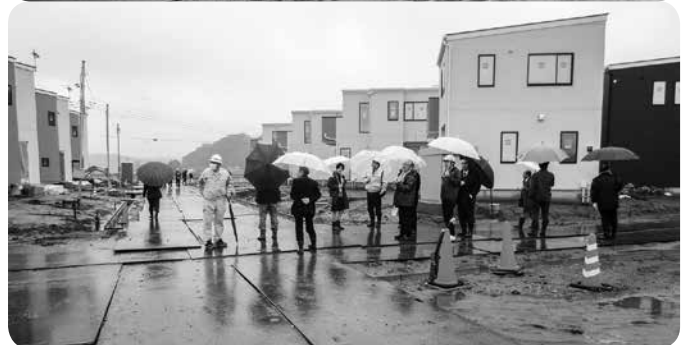
予算審査特別委員会ウエルネス住宅現地調査