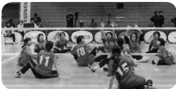
シッティングバレーボール

第4条で傍聴人は自己の住所、氏名、年齢を傍聴人受付簿に記入するという規定がある。個人情報保護の観点から、全国町村議会議長会で規定している標準町村議会傍聴規則を現行の「傍聴人受付簿」から「傍聴人受付票」に改める一部改正について通知があり、本町の規則も同様に改めるものです。