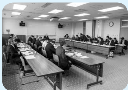
予算審査特別委員会

(2) 学校・家庭・地域社会の連携による、子ども子育て支援の環境づくりを踏まえ、議会とも十分な協議を重ねながら、園