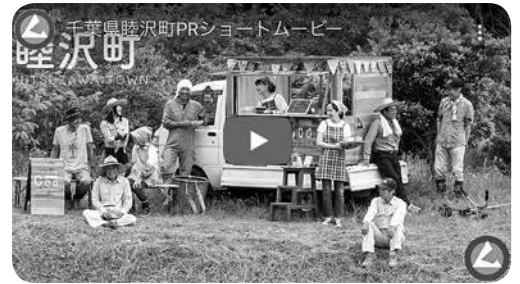
睦沢町 PR ショートムービー