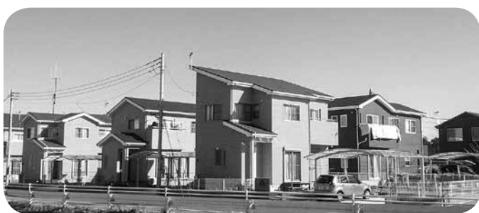
リバーサイドタウン