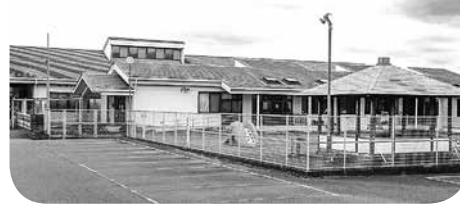
睦沢こども園駐車場

どではトイレが必要と考えますので、予算・管理面など地元と協議して検討していきます。