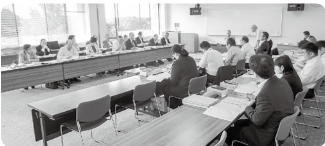
決算審査特別委員会