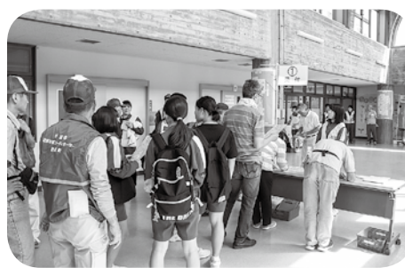
災害ボランティアセンター運営訓練の様子