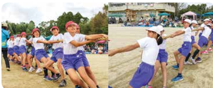
睦沢小学校運動会

今年の九月は暑かったですね。皆さん、どうしのぎましたか。そう、台風15号の暴風とその後の大停電。我が家の裏山では直径50cm程のドングリの木2本、寄り添うように根こそぎ倒されています。特に困ったことでもなく、しばらくこのままにしておこうと・・・。 この後、数日間の停電になろうとは予想もしませんでした。昼夜問わずの暑さのなか愛用の扇風機も動かず、ただただ電気を待つのみ。涼しさを・明かりを・食べ物求め外出すれば、街灯に群がる夏虫のように、電気のある所に大勢の方々が集まっていました。 便利な生活環境が一瞬にして失われる出来事により、木陰を大切に、自給自足を大切にすることを思い知らされました。 M・K