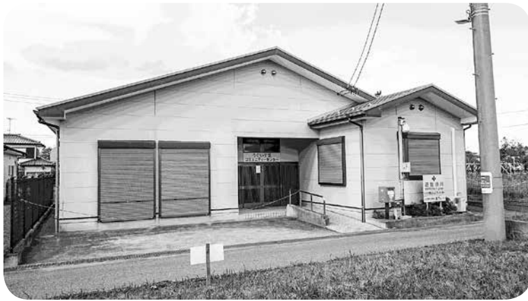
うぐいす里コミュニティセンター