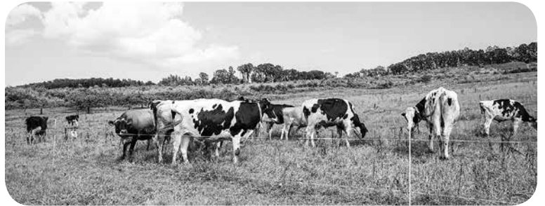
酪農風景 イメージ