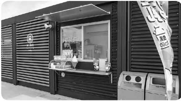
オリーブの森のカフェ (道の駅)