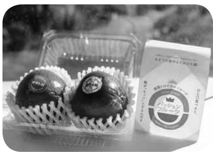
睦沢町産パッションフルーツ

議員 町全体の政策課題こそワークショップの手法を使うべきだと思いが。 町長 町民からの幅広い意見を取り入れていきます。 議員 公共施設を専門的な分野に活用できるようにしていくべきと考えるが。