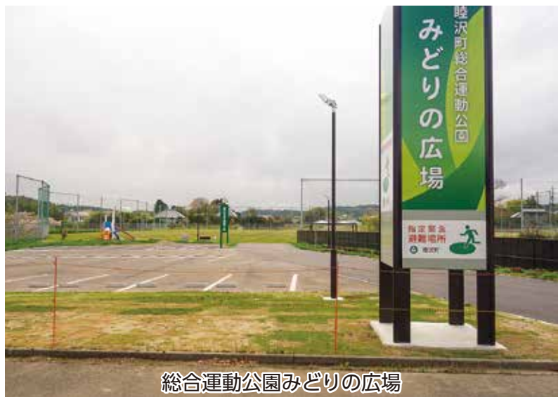
総合運動公園みどりの広場