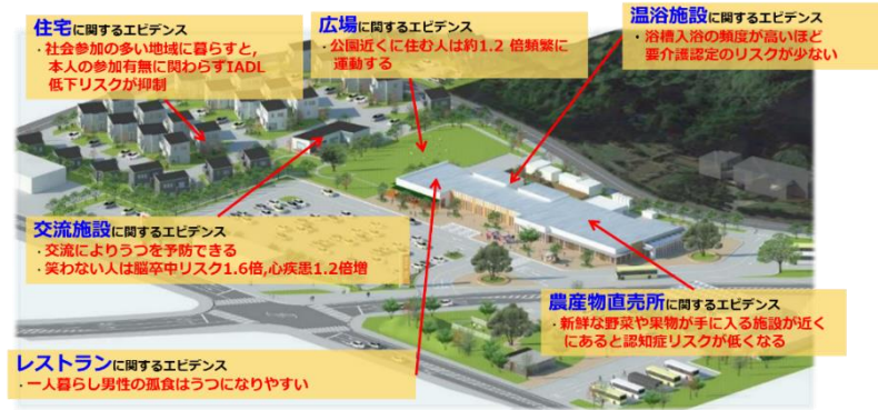
図 「健康支援型」道の駅

千葉県睦沢町では、町民の誰もが、健康を意識せずとも「暮らしているだけで健康になる」まちづくりによって主観的健康感の向上を目指す、先進予防型まちづくりに取り組んでいます。主観的健康感とは、本人が健康と感じているかを問う指標で、本指標が良好な方は生存率が高いことが明らかになっています。その取り組みの1つとして、「外出すること」や「人と会うこと」