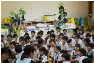
陸沢中学校2年生来園